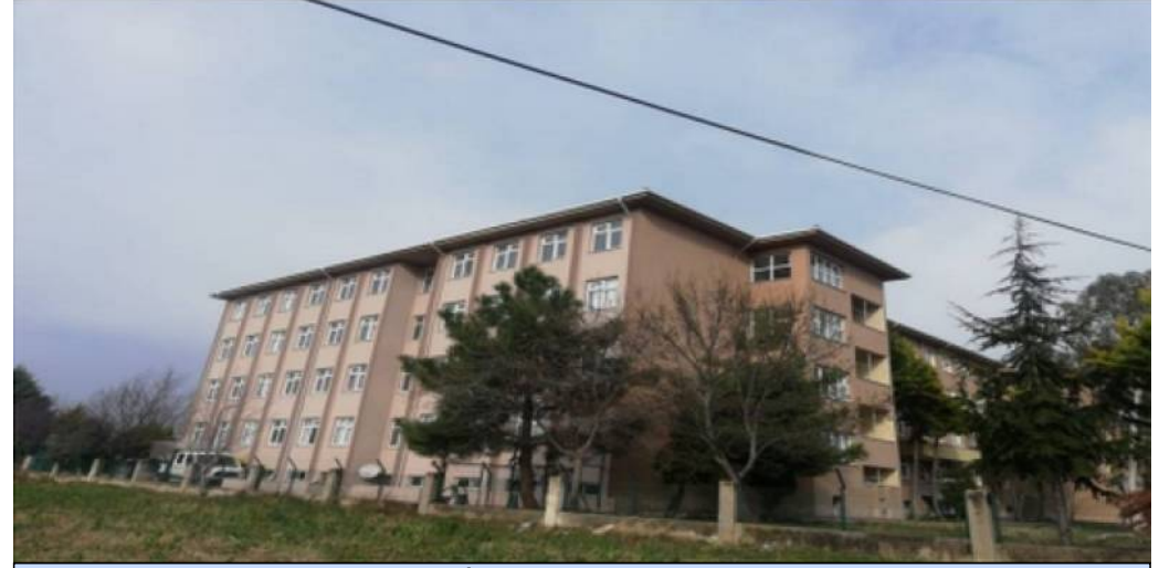
BİNA YAN CEPHE-1