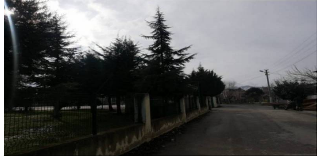
BİNA İHATA DUVARI