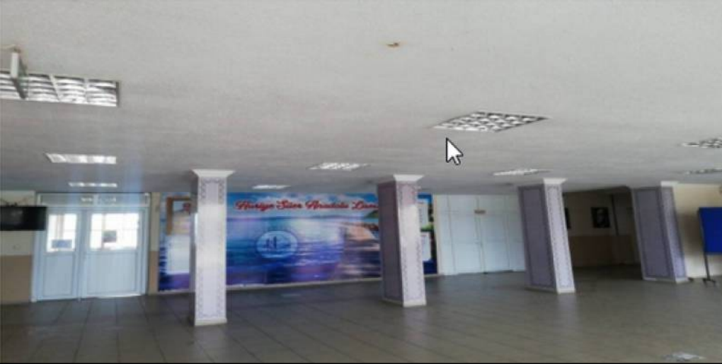
BİNA GİRİŞ DIŞ KISIM