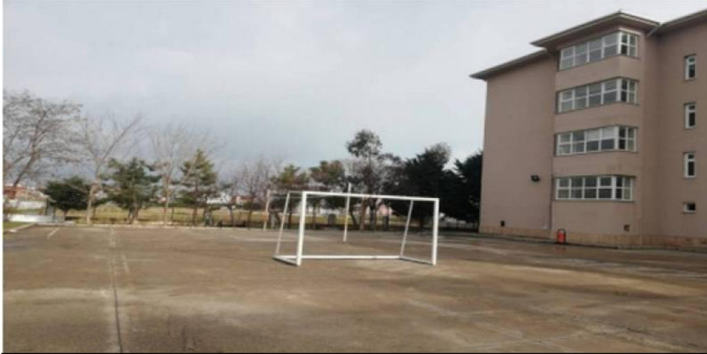
BİNA YAN CEPHE-2