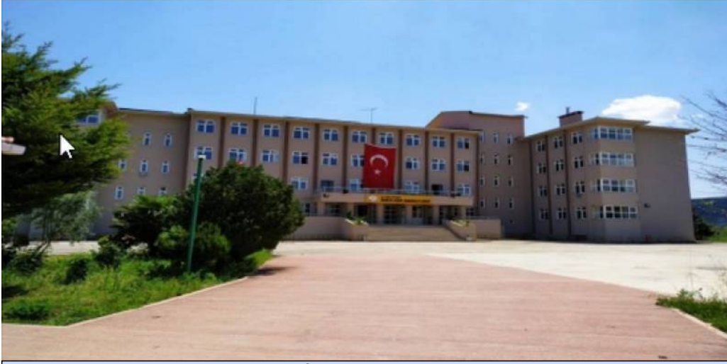
BİNA ÖN CEPHE